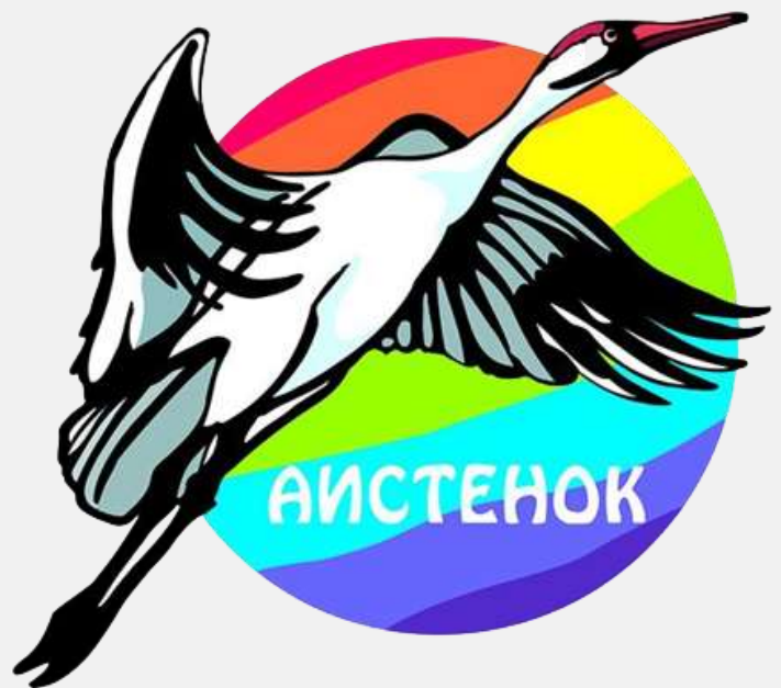
ФОНД СОЦИАЛЬНОГО СТРАХОВАНИЯ РОССИЙСКОЙ ФЕДЕРАЦИИ