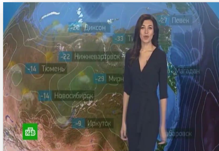
Утренний прогноз погоды на 25 ноября ▾ 1.2K views · 4 months ago