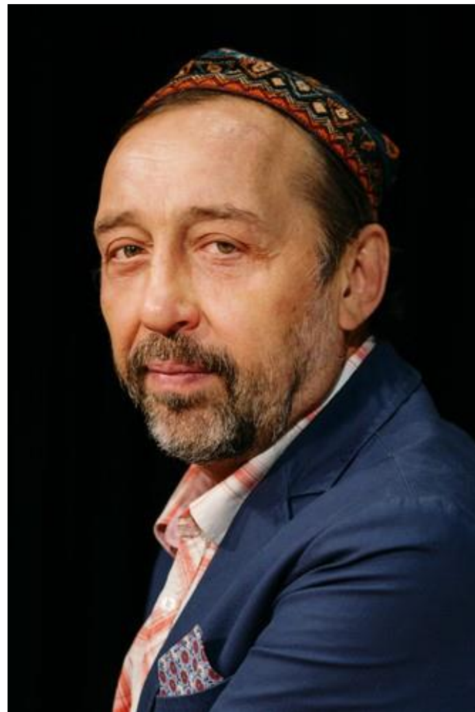
Николай Коляда Театральный режиссер, актер, драматург

Материалом проводимого исследования послужило открытое видео-интервью актера, драматурга, театрального режиссера Николая Коляды (2019). Это видео-интервью содержит богатый материал для исследования лексических средств выражения эмоций в речи творческого человека. Объектом исследования является категория эмотивности, а предметом – ее функционирование в речи творческого человека