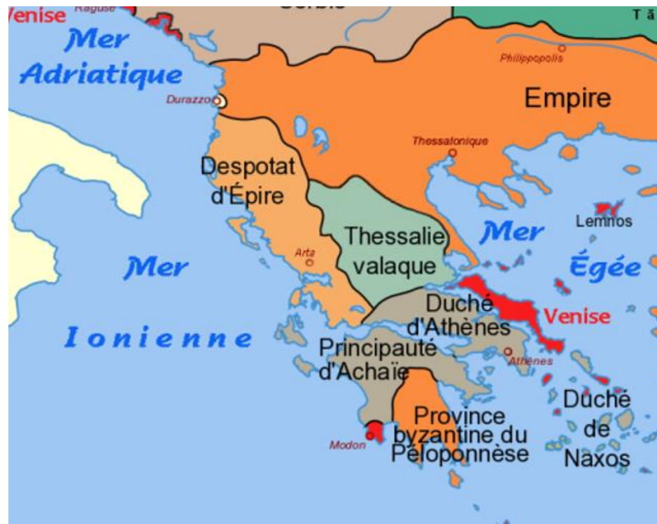
Пелопоннес после реставрации Византийской империи

Военные действия в это время велись фактически непрерывно. Суверенитет Карла I Анжуйского (1266-1282/85) над Ахейским княжеством с 1267 г. превратил Пелопоннес в одно из полей битвы между королем Сицилии и византийским императором.