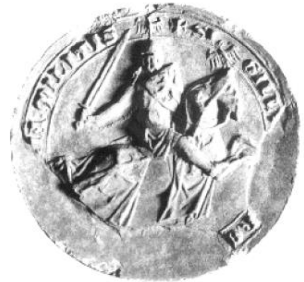
6 Seal of Florent de Hainault

Благодаря заключенному договору, в течение семи лет Пелопоннес пребывал в мире, который приветствовали обе стороны. По сравнению с предыдущими десятилетиями, в истории греко-латинского взаимодействия подобный по протяженности мир был уникальным. Достигнутое соглашение дало населению Пелопоннеса восполнить принесенные долгой войной потери и интенсифицировало мирные контакты латинян с греками. И, хотя временами происходили незначительные военные столкновения, все же, по словам автора хроники, «франки и ромеи богатели и процветание вернулось в страну» .