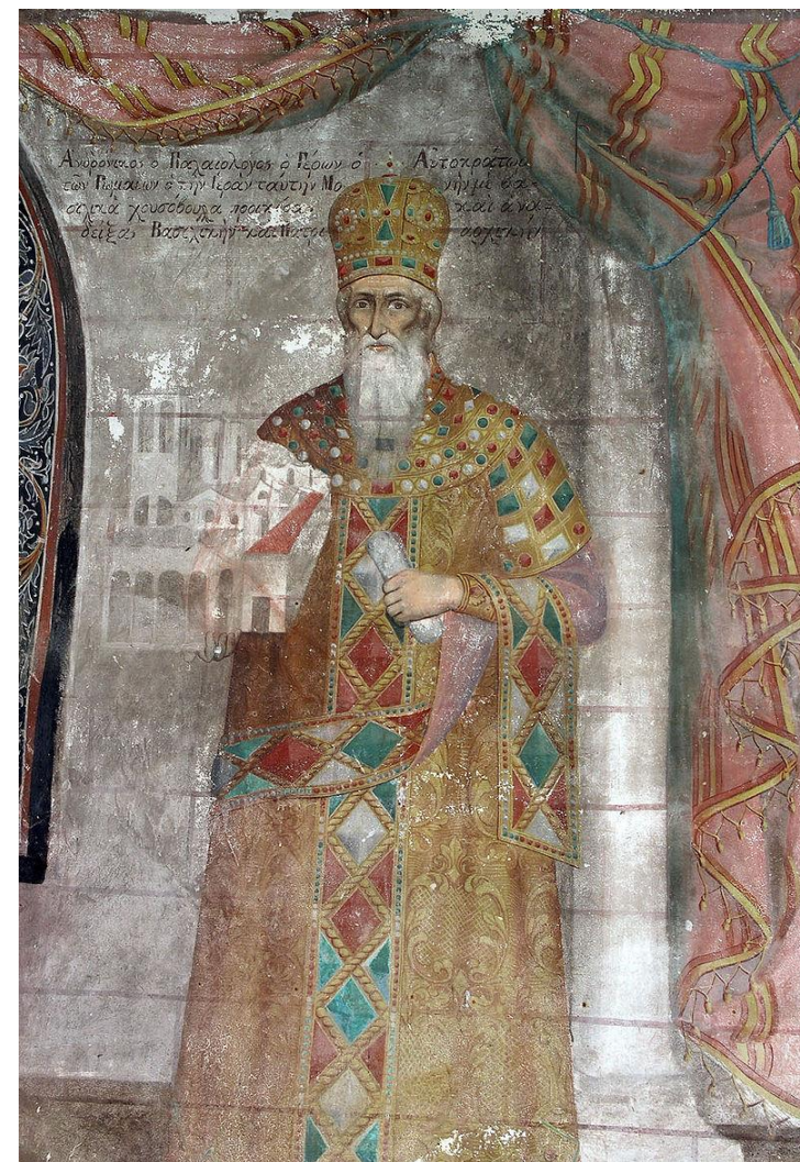
Фреска с изображением Андроника II (Серре, Греция)

Итог мирных переговоров был отражен в хрисовуле Андроника II от 1289 г., согласно которому каждая из сторон сохраняла принадлежавшие ей территории на необходимое для восстановления время.