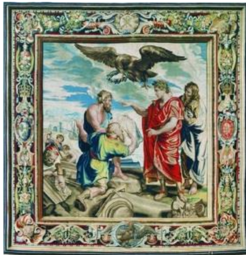
Константин Великий руководит строительством Константинополя

В концепции византийской государственности красной нитью проходила идея, согласно которой Бог руководил Константином при выборе места для основания новой столицы. Поэтому Константинополь выступал как Божий град, новая столица, соединяющая в себе авторитет унаследованных от Старого Рима институтов императорской и гражданской власти с авторитетом христианства. Подобное сочетание определяло уникальность города в рамках империи. Сама двойственная природа Константинополя как политического символа позволяла двойное истолкование. Соотнесение Константинополя с Иерусалимом подчеркивало благость и священство, с Римом - власть и царство.