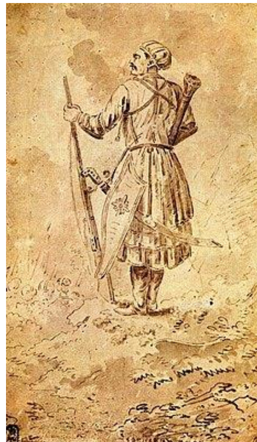
Ф. А. Васильев. Портрет князя Александра Бековича-Черкасского

Важное место среди методов укрепления связей между Россией и Кабардой играл институт аманатства. Например, Александр Бекович-Черкасский пользовался большим влиянием среди кабардинских князей. Под его воздействием кабардинцы в 1711 г. вступили в войну на стороне России, в 1714 г. присягнули на верность Петру I, в 1717 г. участвовали в Хивинской экспедиции.