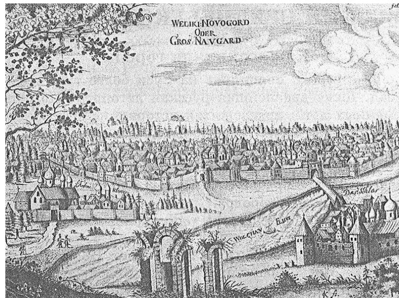
Великий Новгород в XVII веке

Отписка воеводы может считаться полноценным самостоятельным источником в рамках судебного дела. Однако он не дает полной информации о завершении судебного разбирательства и о мерах наказания, т.к. является промежуточным звеном в сложной цепи следственного процесса.