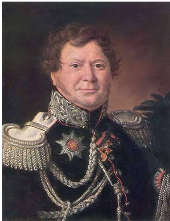
Николай Николаевич Муравьев

Президентом стал Н.Н. Муравьев – отец М.Н. Муравьева, а сам инициатор стал его директором.