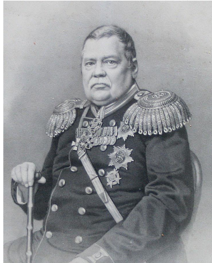
Михаил Николаевич Муравьев