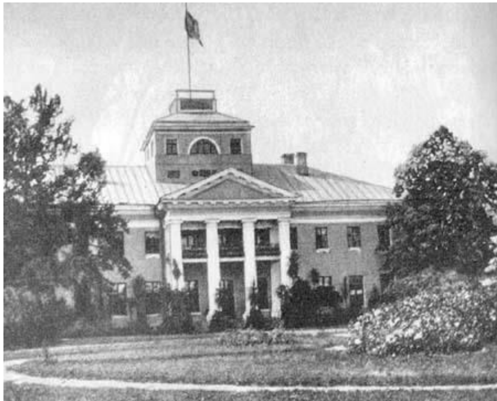
Усадьба Н.Н. Муравьева Александровское-Осташёво

Летом все выезжали в село Александровское, где продолжалось чтение лекций, проходили практические занятия и съемки местности.