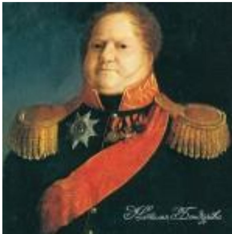
Николай Николаевич Муравьев

Московское училище было переведено в Санкт-Петербург, соединившись с местным училищем для колонновожатых.