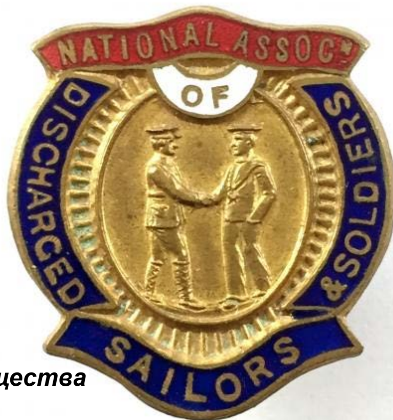
Значок общества NADSS