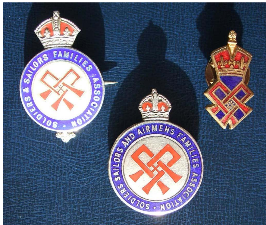
Значки, общества SaSFA