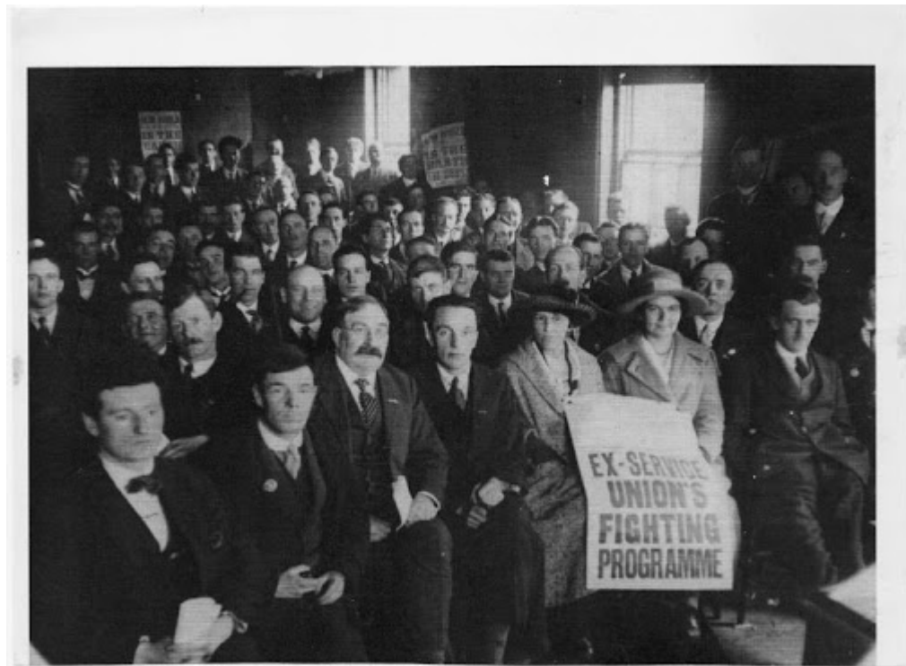
Собрание NUX в г. Бирмингем