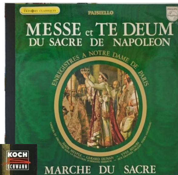
Месса и Те Деум Коронации Наполеона Пластинка 1969 года. Записан под руководством А. Бирбаума

Важным источником также можно считать две записи коронационной музыки, сделанные в 1969 году во Франции оркестром под руководством Армана Бирбаума, и в 1996 году в России под руководством дирижёра Владислава Чернушенко.