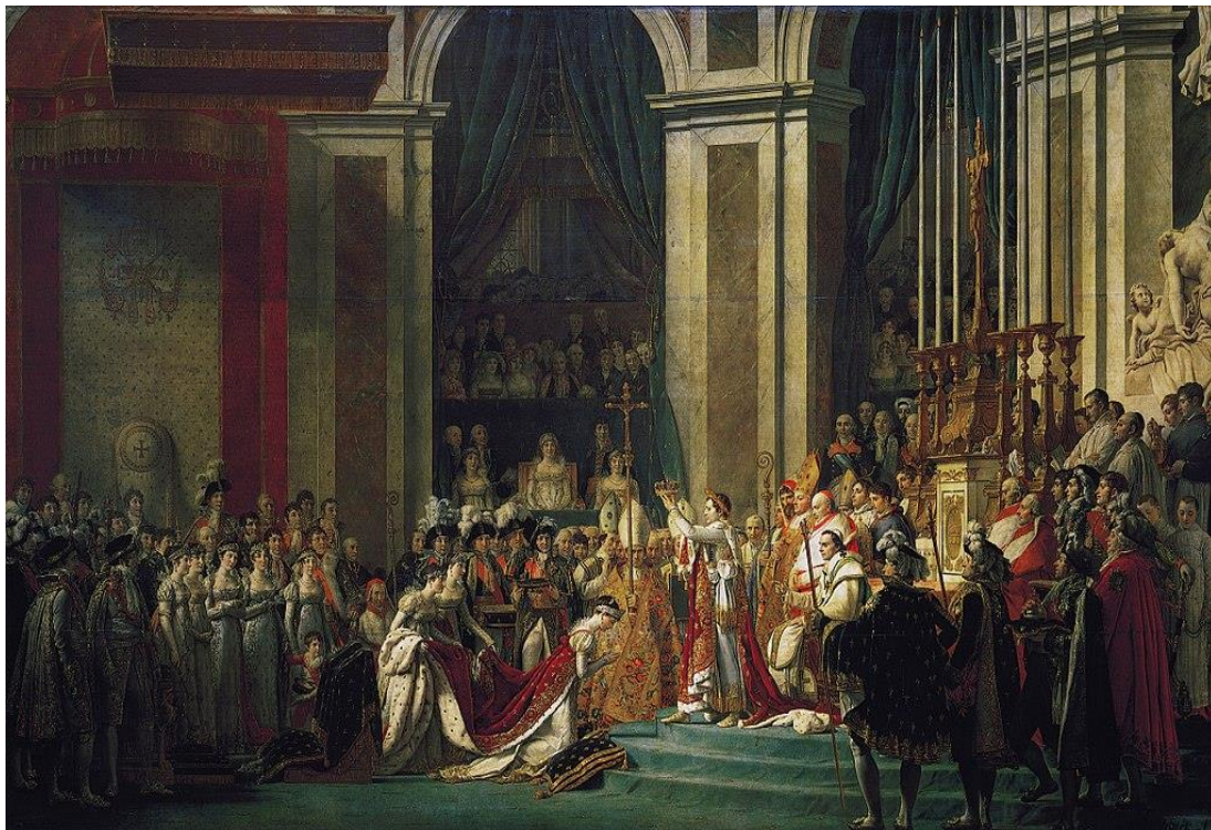
Коронация Наполеона Жак-Луи Давид (написана по заказу Наполеона I в 1805-1807 годах)

В прошлом году исполнилось 215 лет со дня провозглашения Первой империи. Это событие стало важной политической вехой в истории Франции в начале XIX века и одним из важнейших элементов репрезентации власти императора. Одним из её неотъемлемых элементов стала музыка.