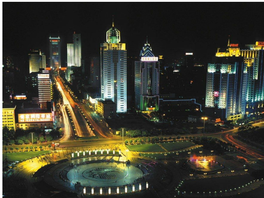
Рис. 5 г. Ухань

Для большинства русских туристов Хайнань примечателен наличием песчаных пляжей и своей схожестью с уже знакомыми Турцией и Египтом. Однако в январе 2020 года российские туристы резко отказались от путешествий как на Хайнань, так и в другие регионы страны, а российские аэропорты частично закрыли авиасообщение с Китаем. Причиной этому стал так называемый коронавирус – новый вид пневмонии, эпидемия которого вспыхнула в столице провинции Хубэй, городе Ухань.