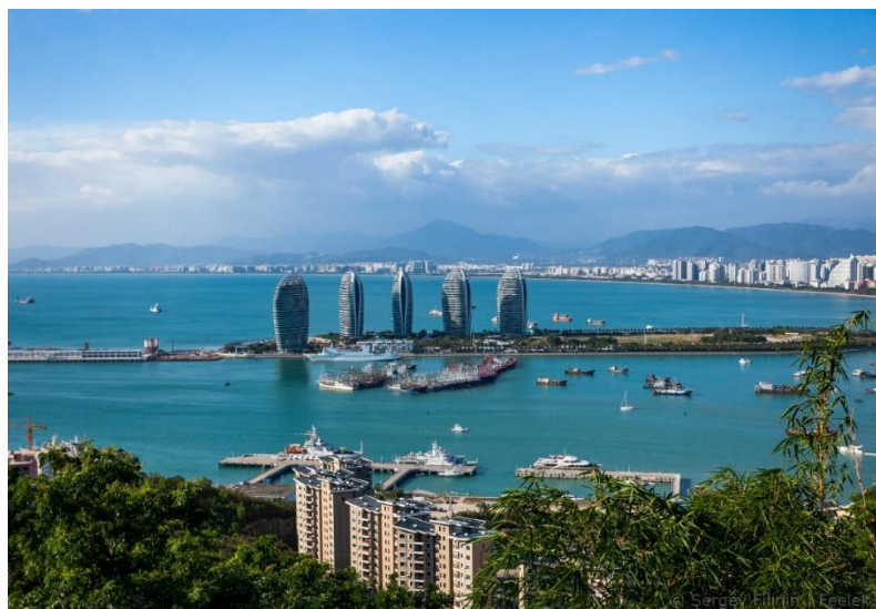
Рис. 2 Искусственный остров «Феникс» у берегов острова Хайнань.