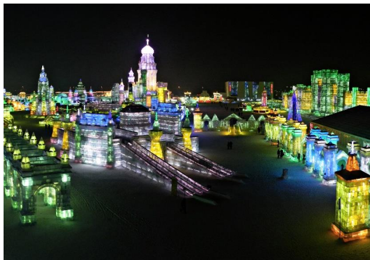
Рис. 4 Ледовый фестиваль в Харбине

Исследованиями по теме занимались: Ефремова М.В., Мартышенко Н. С., Власова Е. Н. и другие. В совокупности с новостными статьями, работы этих исследователей позволяют сделать вывод, что главным и наиболее привлекательным для русских туристов местом отдыха является остров Хайнань на юге Китая [5][6]. Однако туристы с Дальнего Востока России предпочитают посещать такие города, как Пекин, а зачастую – ближайший Харбин.