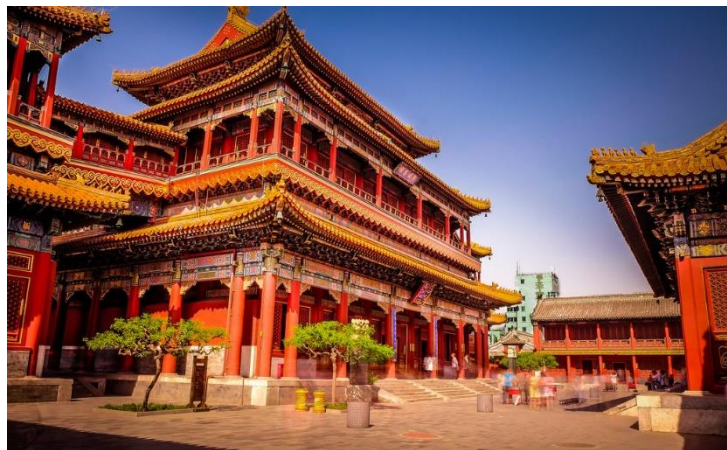
Рис. 3 Императорский дворец в Пекине