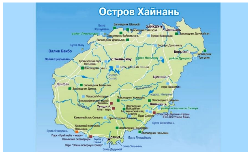
Рис. 1 Карта достопримечательностей острова Хайнань

Политические отношения двух стран нацелены на развитие и укрепление, в Китае проводится множество программ, направленных на туристический обмен с Россией, а на остров Хайнань российский путешественник может попасть без визы