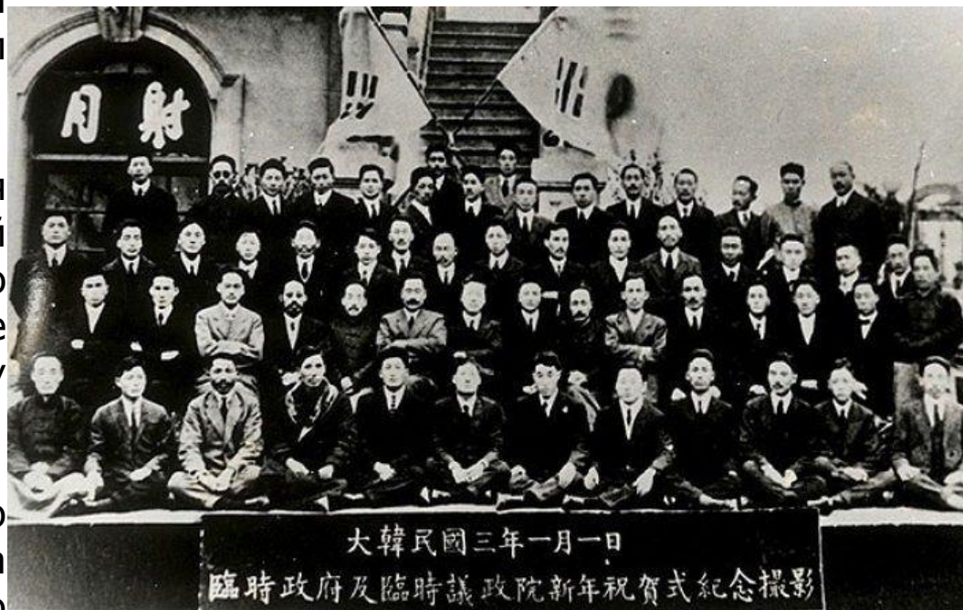
Временное правительство Республики Корея в Шанхае

1919 – возглавляет министерство финансов временного правительства в Шанхае, которое финансировало антияпонское освободительное движение Кореи в Сибири и на российском Дальнем Востоке.