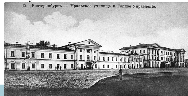
12. Екатеринбург — Уральское училище и Горное Управление.