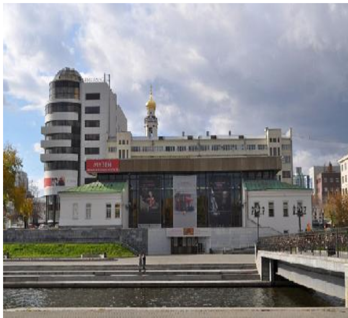
Бывший госпиталь Екатеринбургского железодельного завода (ул. Воеводина,5). Сейчас здесь Екатеринбургский музей изобразительных искусств.

В Екатеринбурге сохранилась плотина Екатеринбургского завода, здание бывшего госпиталя, сейчас здесь музей изобразительных искусств, а также здание механических мастерских, где сейчас располагается музей архитектуры и дизайна.