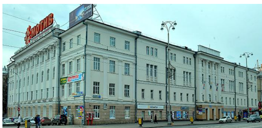
Уральский государственный колледж им. И.И. Ползунова (пр. Ленина, 28)