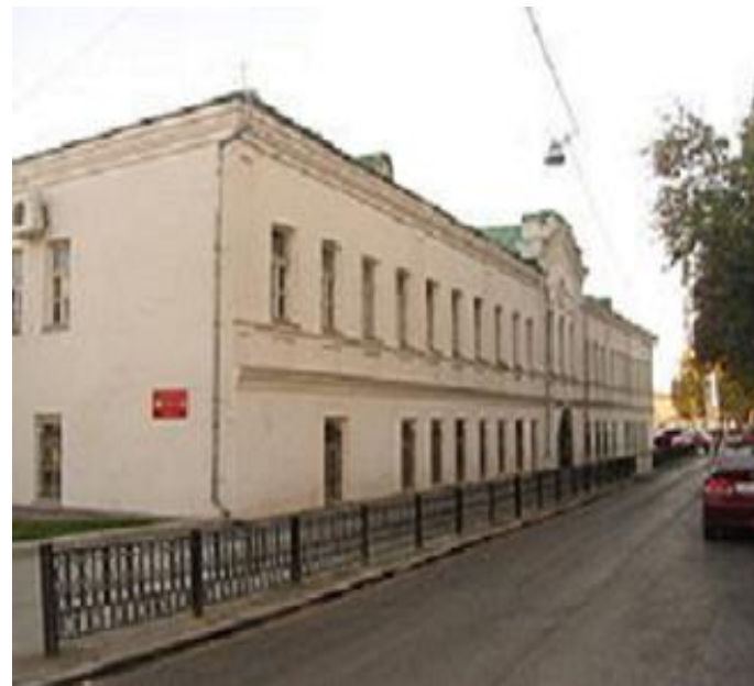
Здание бывших Екатеринбургских механических мастерских (ул. Горького, 4а). Сейчас здесь Музей архитектуры и дизайна УрГАХА