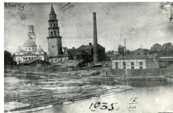
Невьянский завод, 1702 г.