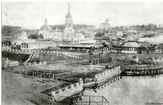
Каменский завод, 1701 г.

Первым заводом на Урале стал казённый Каменский завод. Вторым по счёту стал частный Невьянский завод, построенный Акинфием Демидовым.